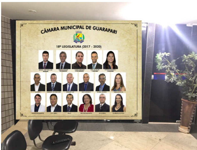
Item 01 – Arte 08: VIDRO ESCADA (FAIXAS) 240 X 40cm