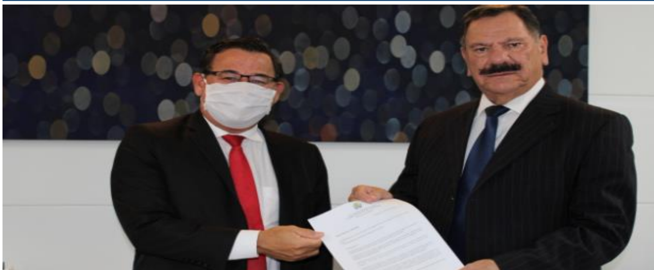
Presidência solicita doação do prédio da Câmara ao Tribunal de Justiça

A presidência da Câmara Municipal de Guarapari solicitou ao Tribunal de Justiça do Estado do Espírito Santo (TJ-ES), a doação do prédio onde funciona o Legislativo Municipal há mais de 20 anos. A solicitação foi anunciada pelo presidente na solenidade de reinauguração do plenário Ewerson de Abreu Sodré e realizada nesta quarta-feira (14) através de um ofício protocolado no TJ-ES.