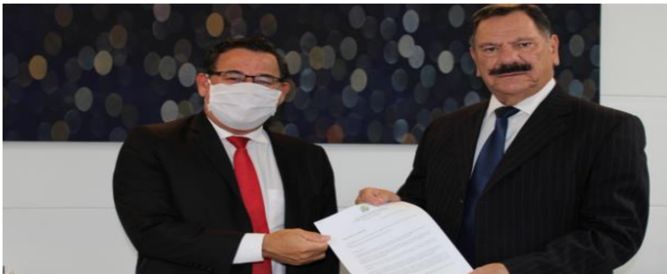
Presidência solicita doação do prédio da Câmara ao Tribunal de Justiça

A presidência da Câmara Municipal de Guarapari solicitou ao Tribunal de Justiça do Estado do Espírito Santo (TJ-ES), a doação do prédio onde funciona o Legislativo Municipal há mais de 20 anos. A solicitação foi anunciada pelo presidente na solenidade de reinauguração do plenário Ewerson de Abreu Sodré e realizada nesta quarta-feira (14) através de um ofício protocolado no TJ-ES.