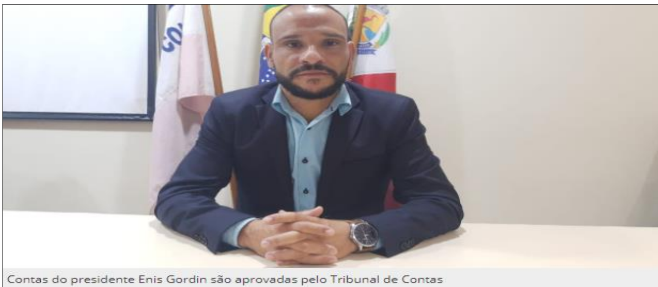
Contas do presidente Enis Gordin são aprovadas pelo Tribunal de Contas

A Prestação de Contas Anual (PCA) do presidente da Câmara Municipal de Guarapari, vereador Enis Gordin (PSB), referente ao exercício de 2019, foi julgada como regular pelo Tribunal de Contas do Estado do Espírito Santo (TCE-ES).