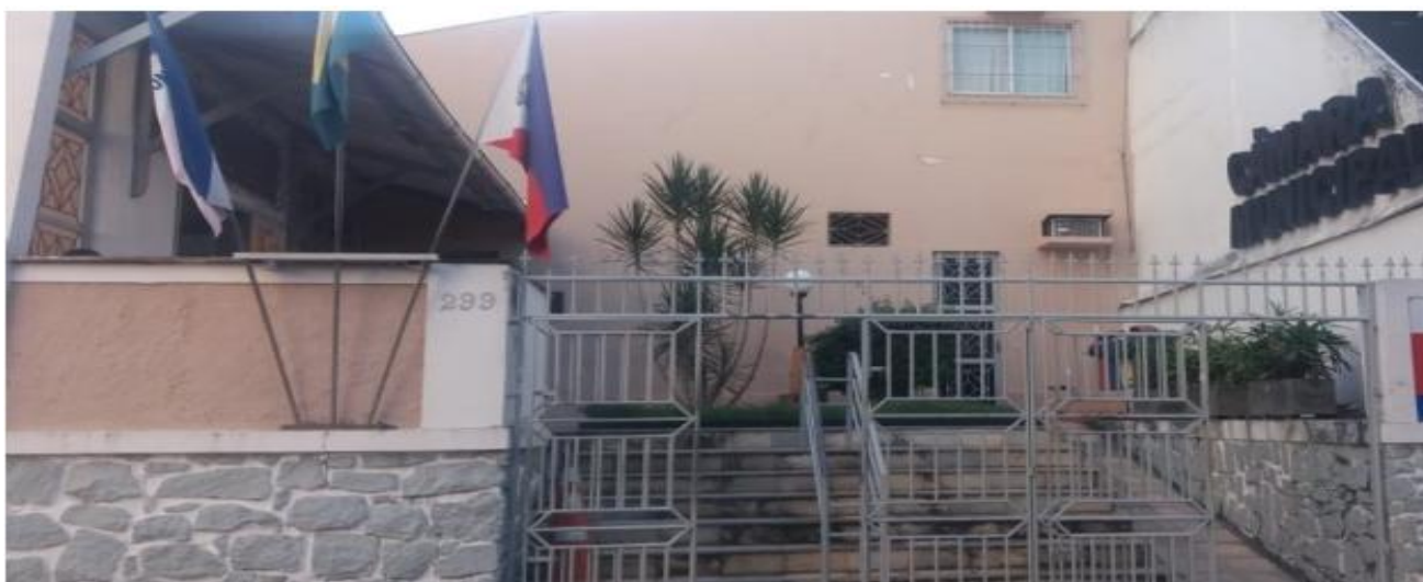
Câmara vota Conselho de Cultura e recebe depoimentos de secretário de Obras, vice-prefeito e maestro em Comissão e CPI

A Câmara Municipal de Guarapari inicia a próxima semana com a votação do projeto que reorganiza o Conselho Municipal de Cultura e três importantes reuniões, sendo duas da CPI dos Shows e uma da Comissão de Economia e Finanças.