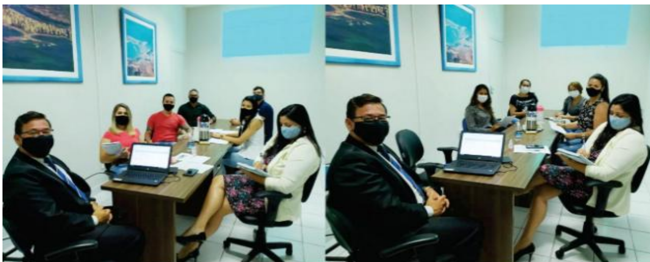
Câmara capacita servidores para virtualização dos processos administrativos

Os servidores da Câmara Municipal de Guarapari participaram, nesta segunda-feira (13), de um treinamento para realizar a tramitação virtual dos processos administrativos da Casa de Leis.