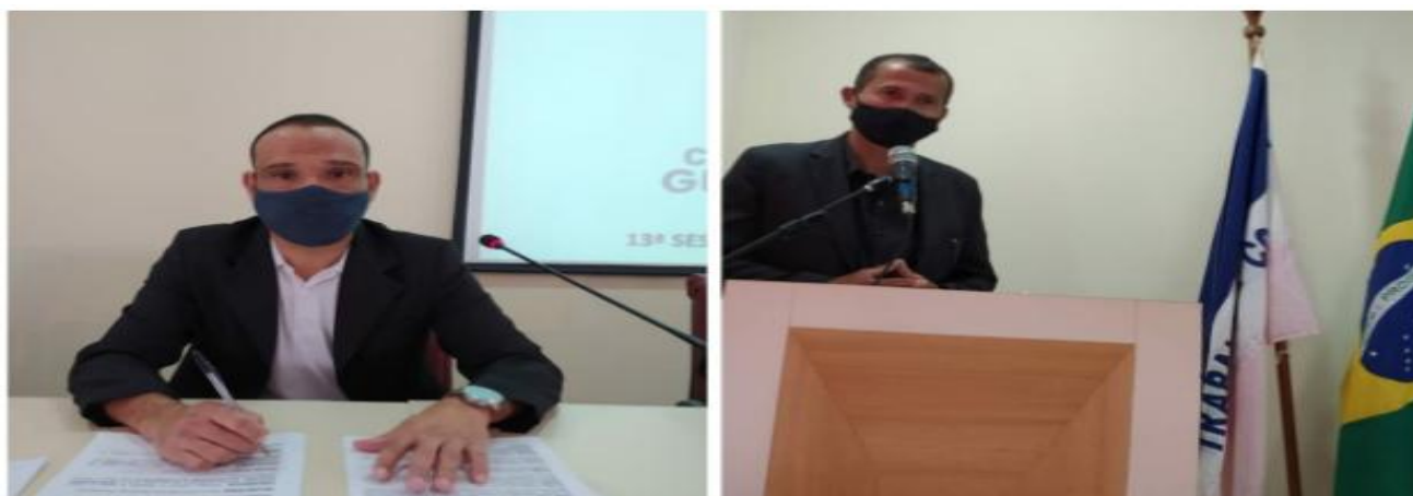
Vereadores aprovam projetos que destinam mais de R$ 100 mil para APAE e novas medidas de combate ao coronavírus

Os vereadores da Câmara Municipal de Guarapari aprovaram, no dia 23 de junho, os Projetos de Lei (PL) nº 55, 56 e 57/2020, que somados destinam R$ 110.265,04 para a Associação de Pais e Amigos dos Excepcionais (APAE) e novas medidas para combater a pandemia do novo coronavírus no município. O PL nº 55/2020 autoriza a prefeitura a firmar um convênio no valor de R$ 50 mil com a APAE. O recurso deve ser empregado no projeto "Construções Inclusivas" para contratação de profissionais especializados para atuarem na reabilitação de pessoas com dificuldades na coordenação motora, compra de material e na manutenção dos serviços socioassistenciais. O PL nº 56/2020 autoriza o repasse de R$ 16.265,04 para ser utilizado pela instituição no pagamento de oficinheiros e compra de material para o projeto Voz e Movimento. Já o PL nº 57/2020 destina R$ 44 mil para ser empregado no projeto "Integrar: deficiência não é limite" com a contratação de pessoal técnico especializado e o pagamento de encargos sociais.