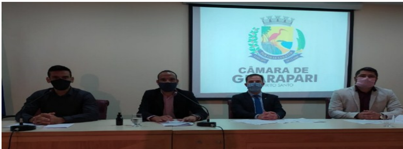
Vereadores aprovam projetos que traz R$ 730 mil para saúde e reajuste aos agentes de combate às endemias

A Câmara Municipal de Guarapari aprovou por unanimidade três Projetos de Lei (PL) que somados trazem R$ 730 mil para a Secretaria Municipal de Saúde (SEMSA) e o reajuste salarial dos agentes de atendimento em saúde, agentes comunitários de saúde e agentes de combate às endemias. A votação foi realizada na 11ª sessão extraordinária, nesta sexta-feira (05).