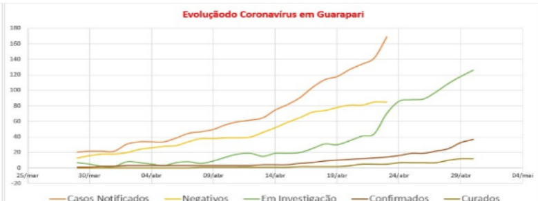
CORONAVÍRUS: Em percentuais, e proporcionalmente em relação à população, Guarapari tem quase a metade de infectados do que tem o Estado

Um levantamento estatístico realizado pela assessoria da presidência da Câmara Municipal de Guarapari com base nas informações divulgadas pelo Governo do Estado e pela prefeitura de Guarapari concluiu que até esta quinta-feira (30) 0,03% da população da cidade saúde estava infectada com o novo coronavírus. Enquanto em todo Espírito Santo 0,07% dos capixabas testaram positivo para a doença. Ou seja, proporcionalmente em relação ao número de habitantes, em percentuais, o município registrou metade dos casos confirmados no Estado.