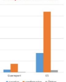
Evolução dos Confirmados