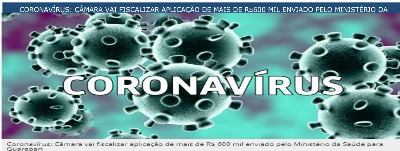
Coronavírus: Câmara vai fiscalizar aplicação de mais de R$ 600 mil enviado pelo Ministério da Saúde para Guarapari

A Câmara Municipal de Guarapari, através da Comissão de Saúde e Assistência Social, vai fiscalizar a aplicação dos recursos enviados pelo Ministério da Saúde para o combate da pandemia de coronavírus no município. Ao todo a cidade recebeu R$ 668.537,60, sendo R$ 326.756,00 encaminhado no dia 31 de março e R$ 341.781,60 em 13 de abril.