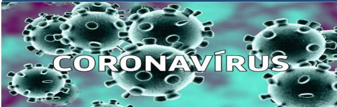
Coronavírus: Câmara vai fiscalizar aplicação de mais de R$ 600 mil enviado pelo Ministério da Saúde para Guarapari

A Câmara Municipal de Guarapari, através da Comissão de Saúde e Assistência Social, vai fiscalizar a aplicação dos recursos enviados pelo Ministério da Saúde para o combate da pandemia de coronavírus no município. Ao todo a cidade recebeu R$ 668.537,60, sendo R$ 326.756,00 encaminhado no dia 31 de março e R$ 341.781,60 em 13 de abril.