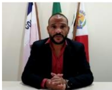
O presidente Enis Gordin lembrou que além da videoconferência, a virtualização dos processos da Câmara possibilita que os servidores trabalhem de casa.

O presidente da Câmara, vereador Enis Gordin (PSB), ressaltou que além das videoconferências realizadas pelo aplicativo, a virtualização dos processos da Casa de Leis possibilitou que os servidores pudessem trabalhar de casa. "No ano passado começamos a virtualização dos processos pensando na economia e no meio ambiente. Agora isso também está garantindo que nossos servidores continuem trabalhando em suas casas sem colocar em risco a saúde deles e de seus familiares. Fico feliz em saber que essa medida está evitando que o coronavírus se espalhe por nossa cidade", finalizou Enis.