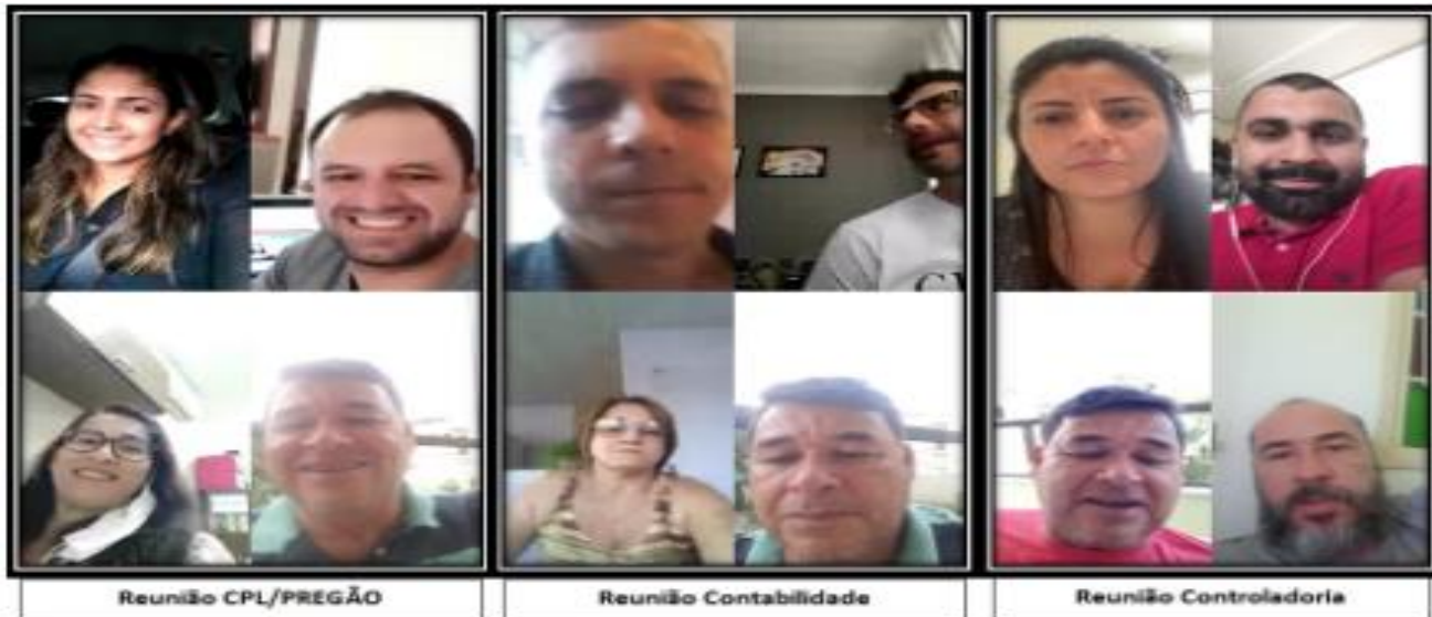
Coronavírus: Servidores da Câmara trabalham por videoconferência

Em decorrência da pandemia de coronavírus, os servidores dos setores administrativos da Câmara Municipal de Guarapari estão realizando suas atividades no sistema home office e para isso contam com o auxílio do aplicativo de mensagens Whatsapp para realizar reuniões em vídeo.