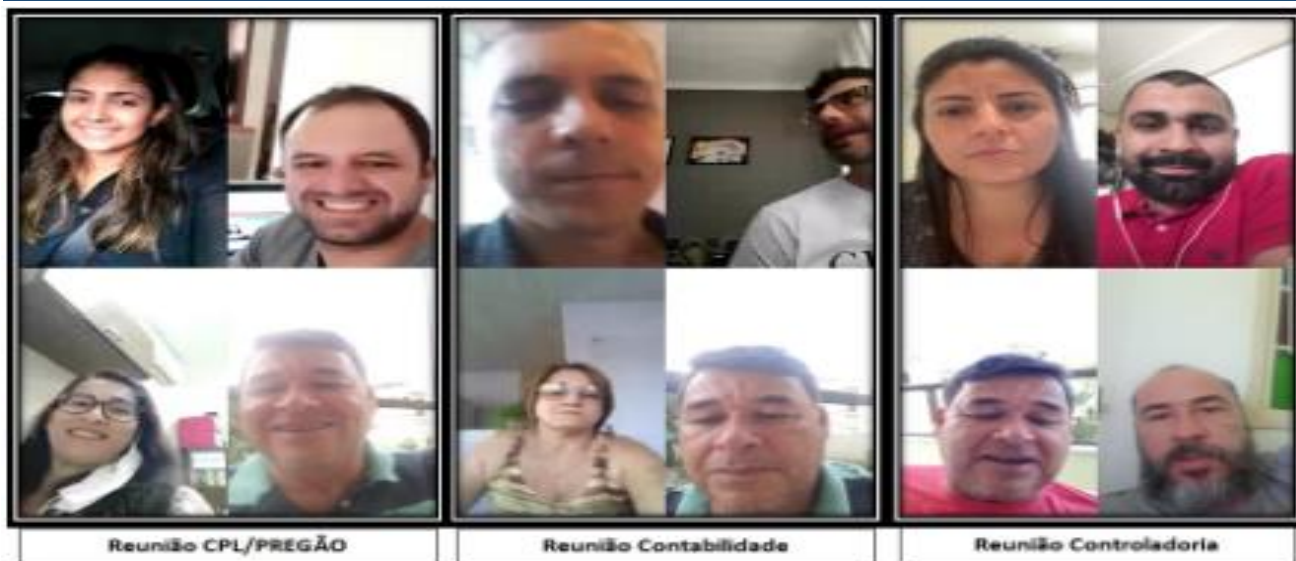
Coronavírus: Servidores da Câmara trabalham por videoconferência

Em decorrência da pandemia de coronavírus, os servidores dos setores administrativos da Câmara Municipal de Guarapari estão realizando suas atividades no sistema home office e para isso contam com o auxílio do aplicativo de mensagens Whatsapp para realizar reuniões em vídeo.