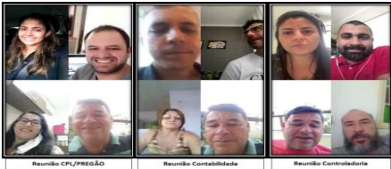
Coronavírus: Servidores da Câmara trabalham por videoconferência

Em decorrência da pandemia de coronavírus, os servidores dos setores administrativos da Câmara Municipal de Guarapari estão realizando suas atividades no sistema home office e para isso contam com o auxílio do aplicativo de mensagens Whatsapp para realizar reuniões em vídeo.