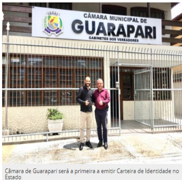
Câmara de Guarapari será a primeira a emitir Carteira de Identidade no Estado