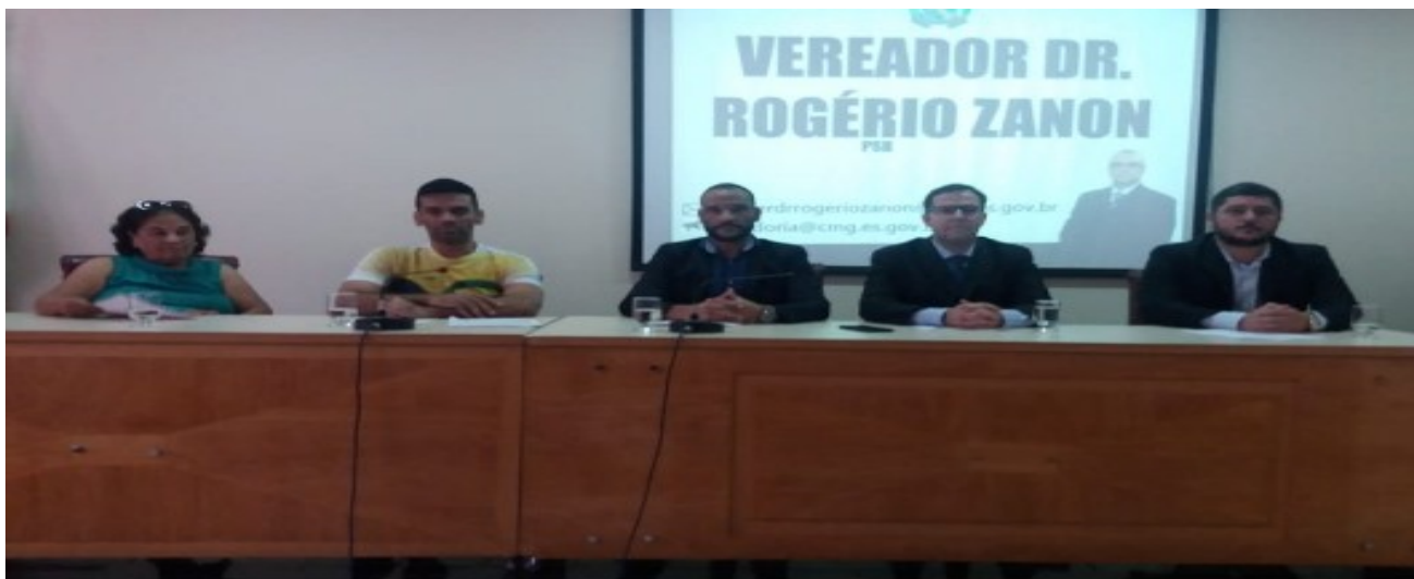
Vereadores aprovam reajuste de 12,84 % para os professores do município

Os professores da rede municipal de ensino vão receber um reajuste salarial de 12,84% retroativo a janeiro. O benefício vai ser concedido após a aprovação do Projeto de Lei (PL) nº19/2020 que ocorreu na 5ª sessão ordinária, realizada nesta quinta-feira (12).