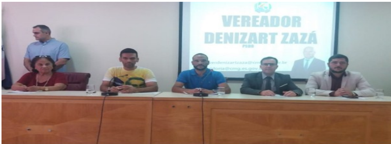
Vereadores aprovam 13 indicações e quatro requerimentos com melhorias para saúde, infraestrutura e transporte de Guarapari

Na 4ª sessão ordinária, realizada nesta terça-feira (10), os vereadores aprovaram 13 Indicações e quatro Requerimentos que tratam de temas como saúde, infraestrutura e transporte.