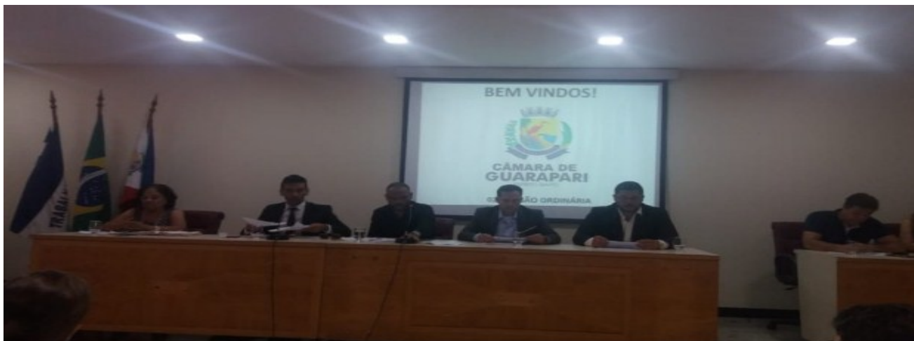
Vereadores vão analisar veto do prefeito às emendas do orçamento de 2020