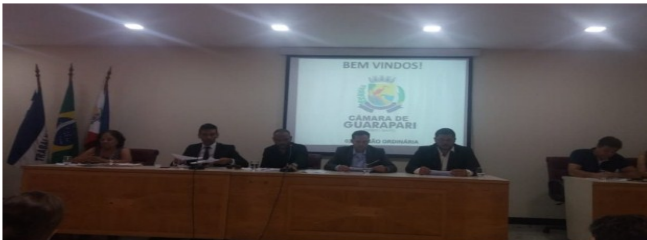
Vereadores vão analisar veto do prefeito às emendas do orçamento de 2020