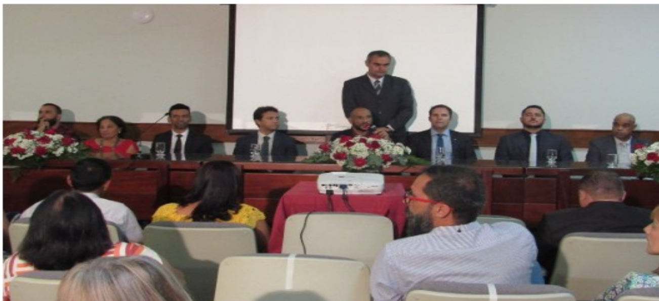
Câmara realiza solenidade para dar início às atividades parlamentares de 2020