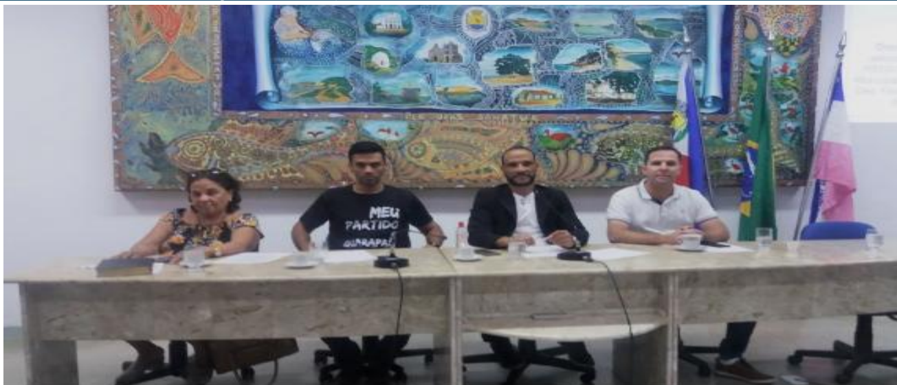
Projeto que libera R$ 500 mil para Saúde é aprovado pela Câmara

A Câmara Municipal de Guarapari aprovou por unanimidade o Projeto de Lei (PL) nº 129/2019, que autoriza a abertura de crédito adicional especial de R$ 500 mil para Secretaria Municipal de Saúde. A votação aconteceu na 1ª sessão extraordinária de 2020, realizada nesta segunda-feira (06).