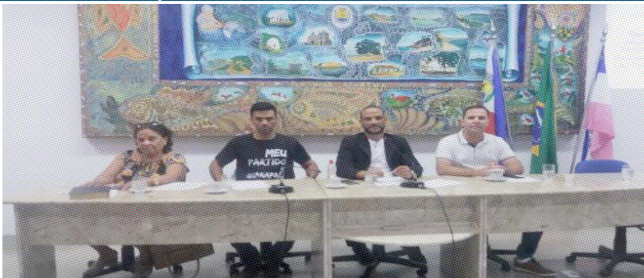
Projeto que libera R$ 500 mil para Saúde é aprovado pela Câmara

A Câmara Municipal de Guarapari aprovou por unanimidade o Projeto de Lei (PL) nº 129/2019, que autoriza a abertura de crédito adicional especial de R$ 500 mil para Secretaria Municipal de Saúde. A votação aconteceu na 1ª sessão extraordinária de 2020, realizada nesta segunda-feira (06).