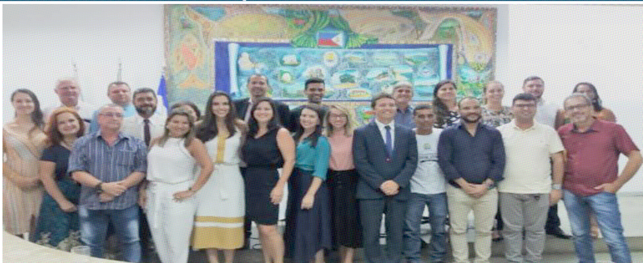
Vereadores aprovam projeto que cria Lei Orgânica para Procuradoria em Guarapari

Os vereadores aprovaram, por unanimidade, o Projeto de Lei Completar nº 005/2019, que estabelece a Lei Orgânica da Procuradoria Geral do município. A votação aconteceu na 15ª sessão extraordinária, realizada nesta segunda-feira (30).