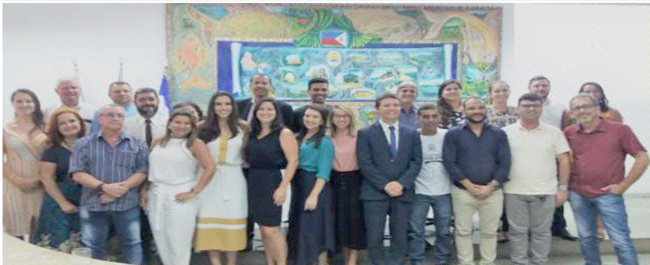
Vereadores aprovam projeto que cria Lei Orgânica para Procuradoria em Guarapari

Os vereadores aprovaram, por unanimidade, o Projeto de Lei Completar nº 005/2019, que estabelece a Lei Orgânica da Procuradoria Geral do município. A votação aconteceu na 15ª sessão extraordinária, realizada nesta segunda-feira (30).