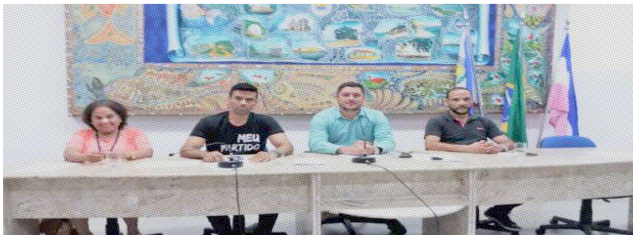
Vereadores aprovam recursos para o carnaval