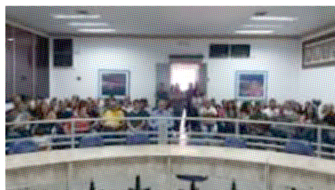
Os servidores vão receber o abono de R$ 700,00 e reajuste salarial de 3%.

Ainda de acordo com o presidente, os servidores também vão receber um reajuste de 3%. “Nós tivemos um entendimento com o Tribunal de Contas e conseguimos conceder um reajuste de 3% para os servidores. Este valor será pago retroativo ao mês de abril de 2019”, explicou o presidente.