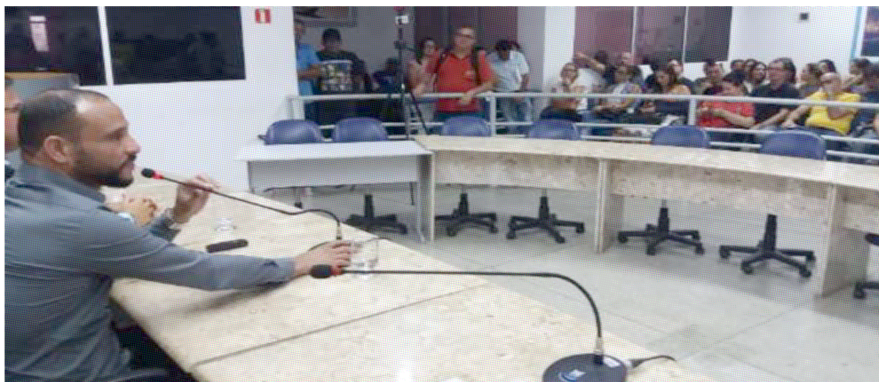
Câmara concede abono aos servidores pela primeira vez na história

Apesar de ter perdido R$ 400 mil de sua receita, a Câmara Municipal de Guarapari vai conceder abono salarial no valor de R$ 700,00 a seus servidores neste final de ano. A Casa de Leis do município tem 340 anos e esta é a primeira vez que o benefício é concedido.