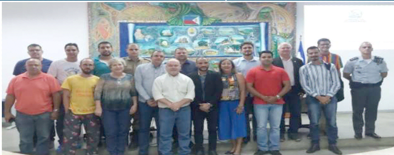
Audiência pública debate regulamentação de shows em Guarapari

A Câmara Municipal de Guarapari realizou uma audiência pública, nesta terça-feira, 10 de dezembro de 2019, para debater a regularização de shows no município.