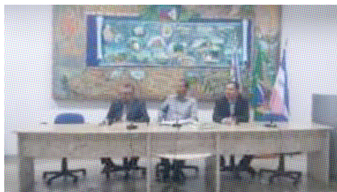
A Comissão de Economia e Finanças será a próxima a analisar o projeto.