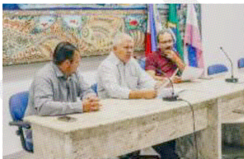
A Comissão de Redação e Justiça está analisando o projeto que trata do orçamento 2020.

No PL a prefeitura diz que pretende gastar R$ 519.150.116,49, ou seja, este é o valor do Orçamento do próximo ano. Neste ano o Orçamento foi de R$ 396.796.711,53, ou seja, se aprovado, o Executivo terá R$ 122.353.404,96 a mais para gastar, o que equivale a uma elevação de despesa de mais de 30% em relação ao valor destinado em 2019.