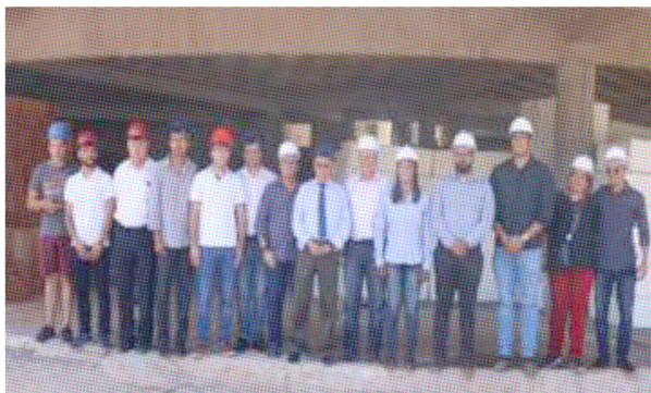
Vereadores e deputados visitam obra de hospital e discutem melhorias na saúde pública em Guarapari

Os vereadores da Câmara Municipal de Guarapari se reuniram, no dia 01 de novembro de 2019, com os deputados Doutor Hércules (MDB) e Emilio Mameri (PSDB), presidente e vice-presidente da Comissão de Saúde e Saneamento da Assembleia Legislativa do Espírito Santo (Ales), para discutir os problemas na atenção primária da saúde do município. Além da reunião, eles realizaram uma visita à obra do Hospital Municipal Cidade Saúde.