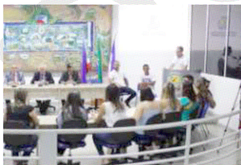
Na reunião, os vereadores apresentaram aos deputados problemas na atenção primária da saúde no município.